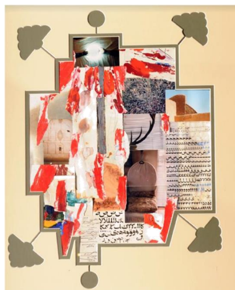
Fereydoun Ave, Persian Miniatures Series, 2006 Mixte media collage sur papier 126 x 90 cm