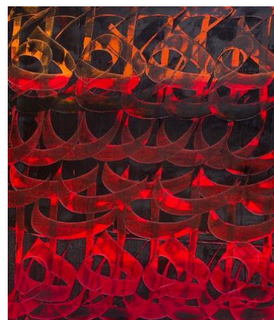
Fereydoon Omid, Untitled, 2012 Huile sur toile 150 x 120 cm