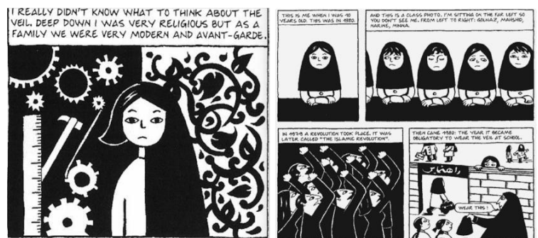
Marjane Satrapi, Persepolis, 2017 Numérique c-print sur papier d'archives 29.7 x 42 cm chaque Unique Edition for MOP