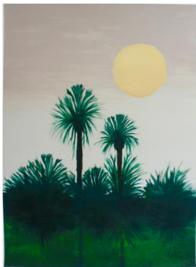
HM Farah Pahlavi Sud Marocain, 2011, lithographie, 100cm x 72cm Edition 1/10