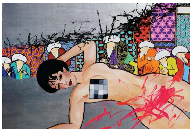
Shaghayegh Shojaeian, 2016, Modigliani in Wonderland Acrylique sur toile, 100 x 145 cm