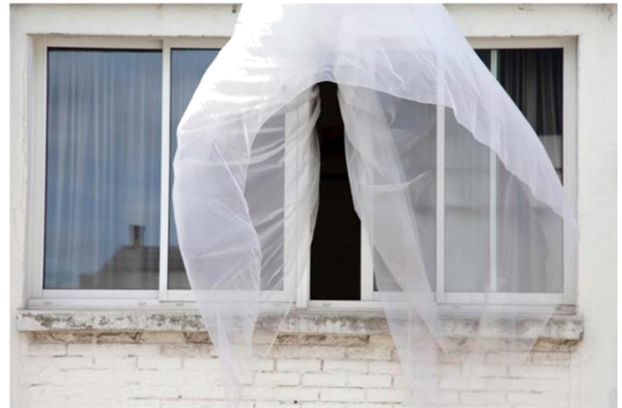
Niloufar Banisadr Voiles aux Vents No.1, 2012 Inkjet print, papier baryté, 110 x 78 cm Edition 5 of 10 + 2 EA