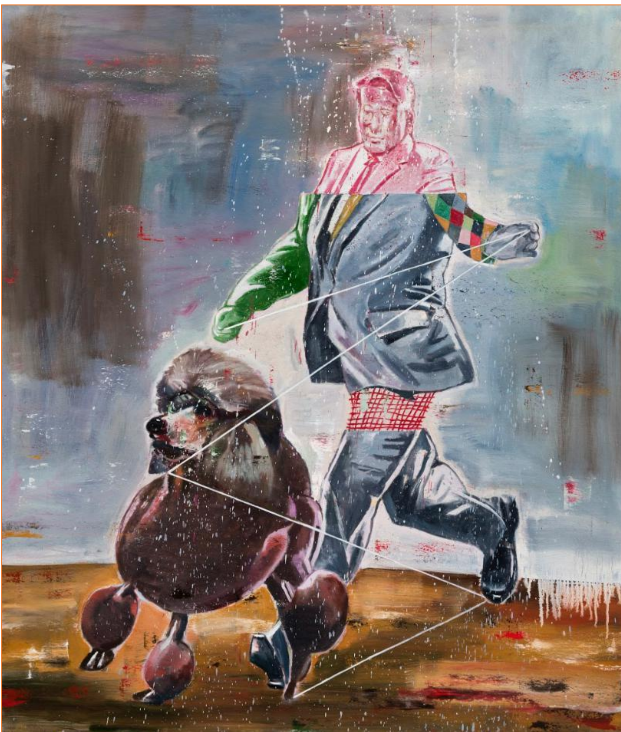
Nicky Nodjoumi, « The Newcomer », 2011-2013 Huile sur toile, 152.4 x 132 cm