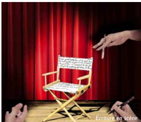
Ecriture en scène