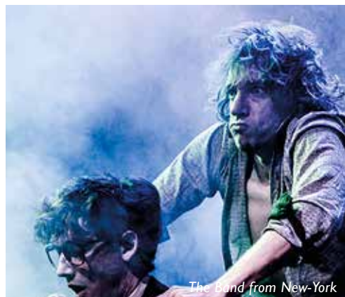
The Band from New-York