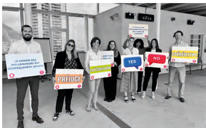
• Atelier mouvant sur la mixité des métiers au lycée FANB