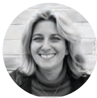
Marina Ceyssac Haut Commissaire à la Protection des Droits et à la Médiation