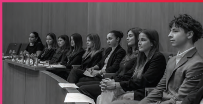
• Pré-sélection du concours d'éloquence « 24h de la vie d'une femme » au Conseil National le 7 mars