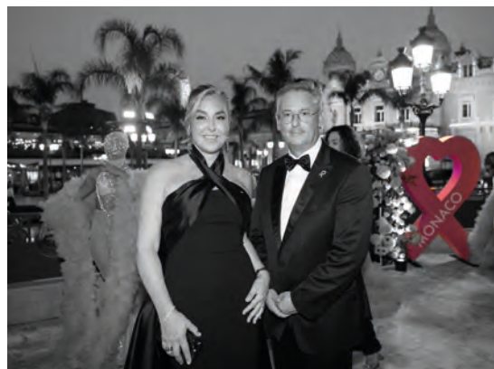
• Soirée Pink Ribbon

Dans le cadre du mois « octobre rose » dédié à la prévention du cancer du sein, Pink Ribbon Monaco a organisé une soirée rassemblant les acteurs de la Principauté impliqués dans la lutte contre le cancer du sein.