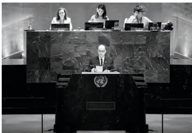
• S.A.S. le Prince Souverain à la tribune de l'ONU lors du Sommet Beijing+30.

« les droits des femmes constituent un pilier fondamental de la paix, du développement et de la justice ».