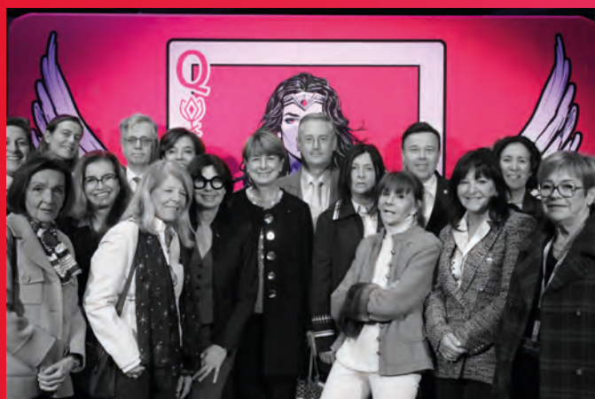
• Photobooth du 8 Mars