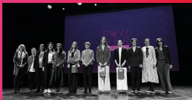
• Finale du concours d'éloquence et remise des prix