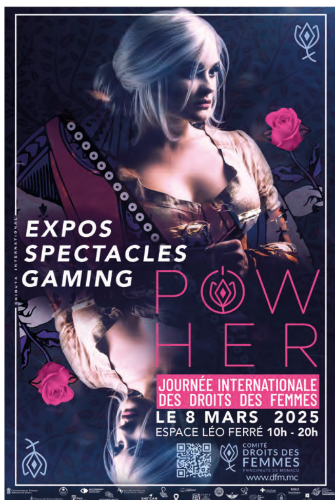
• Affiche POWHER

Créé en 2024, l'événement « POWHER » a été reconduit en 2025 pour une deuxième édition placée sous le signe de la représentation des femmes dans les arts et les médias. Cet événement fédérateur a permis de rassembler à l'espace Léo Ferré l'ensemble des acteurs institutionnels et associatifs monégasques engagés pour la cause des femmes.