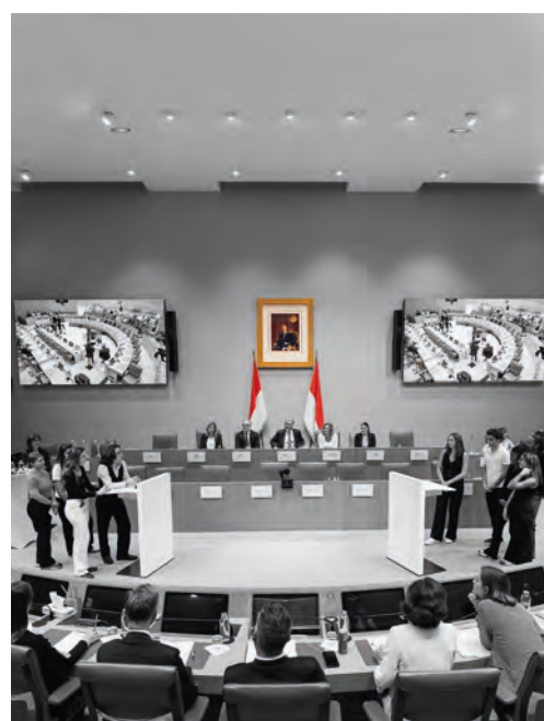
• Journée de la fille au Conseil National

Les sujets abordés incluaient le droit de vote, l'accès des parents aux réseaux sociaux de leurs enfants, ainsi que l'instauration de quotas dans les institutions et entreprises pour les postes à haute responsabilité.