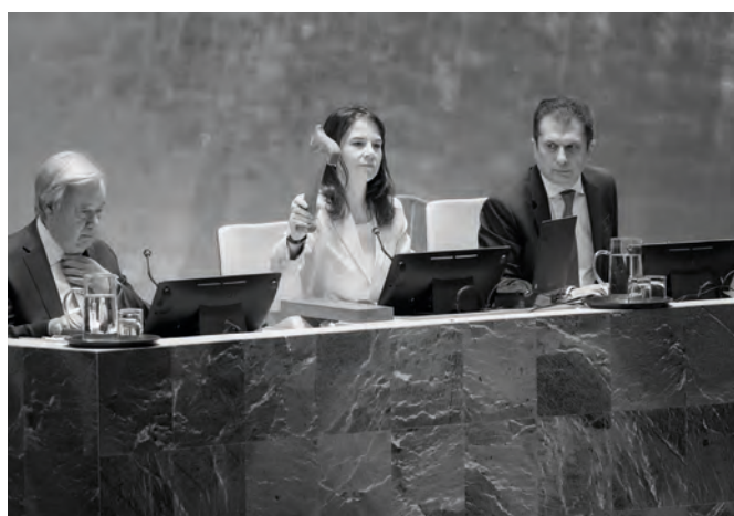
• Mme Annalena BAERBOCK, le jour de sa prise de fonction en tant que Présidente de l'Assemblée générale de l'ONU pour sa 80 ème session.

Dans Son discours à l'ONU, le 24 septembre, S.A.S. le Prince Albert II de Monaco a rappelé, tout en le regrettant, que l'égalité entre les femmes et les hommes n'est toujours pas pleinement et universellement atteinte.