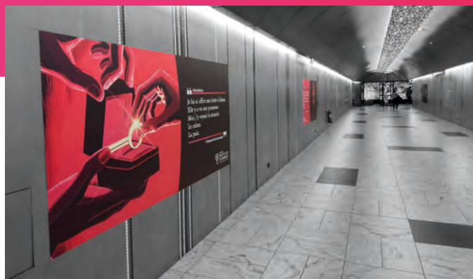
• Affichage dans la galerie commerciale de Fontvieille

Afin d'impliquer les jeunes, un concours vidéo était organisé avec la Direction de l'Éducation Nationale, de la Jeunesse et des Sports. À partir du slogan de la campagne, ils étaient invités à réaliser une vidéo de 1 à 3 minutes, seuls ou en équipe.