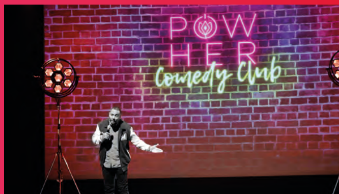
• Spectacle d'humour proposé par Hassan de Monaco, Ambassadeur des droits des femmes

Ce spectacle d'humour présentait trois humoristes de talents : Basile, Myriam Baroukh et Amandine Lourdel pour un moment de légèreté et de détente en abordant des thèmes en lien avec les femmes.