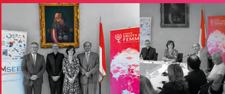
• Présentation à la presse de l'étude sur les écarts de salaire

L'IMSEE a présenté à la presse et publié, le 3 novembre 2025, une nouvelle étude relative aux écarts de salaires entre les femmes et les hommes à Monaco, fondée sur les données de l'année 2024. Ce travail s'inscrit dans la continuité de la première étude conduite en 2019 à la demande du Comité pour la promotion et la protection des droits des femmes. Les résultats mettent en évidence une réduction des écarts de rémunération entre les sexes. Dans le secteur public, la rémunération moyenne des femmes est supérieure de 2,4 % à celle des hommes, contre 0,7 % en 2019. Dans le secteur privé, si les écarts demeurent à l'avantage des hommes, ils se sont atténués, le différentiel de salaire mensuelisé passant de 28,5 % à 18,6 %. L'écart de salaire médian n'est désormais plus que de 0,1 %, témoignant d'une tendance favorable à une plus grande équité salariale sur le territoire monégasque.