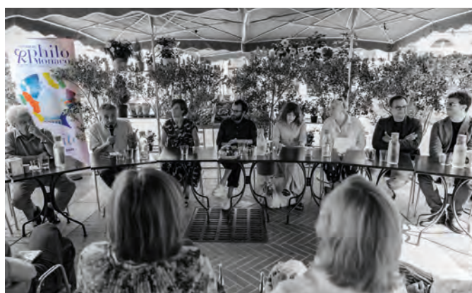
• Semaine PhiloMonaco place du marché de la Condamine