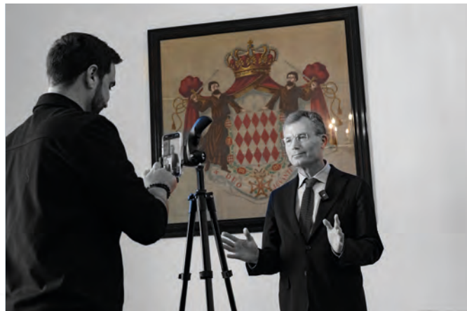
• Le Ministre d'Etat lors de l'enregistrement du message de la campagne de Fight Aids Monaco et She Can He Can

Une campagne portée par des figures clés de la Principauté, était à nouveau organisée pour rappeler le rôle central des hommes dans la lutte contre les violences faites aux femmes. S.E. Christophe Mirmand, Ministre d'Etat, a participé à la campagne cette année.