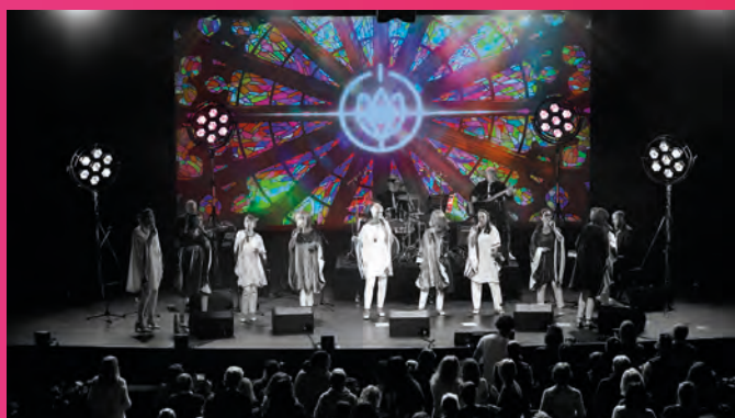
• Concert de gospel

Une formation musicale composée de 10 chanteuses et 4 musiciens. Le groupe interprétait un répertoire varié, comprenant des chants traditionnels du gospel ainsi que des adaptations contemporaines.