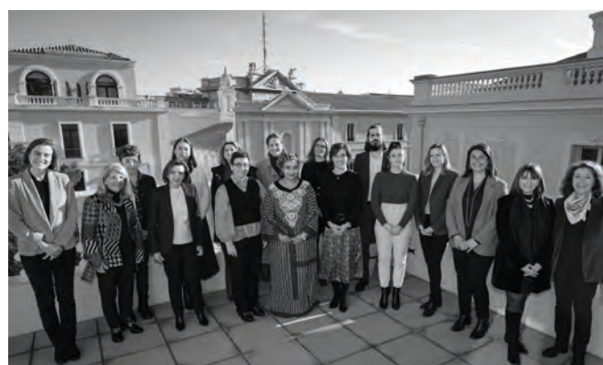
• Réunion d'échanges avec Djaïli Amadou Amal