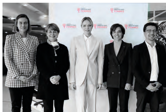
• S.A.S. la Princesse Charlène lors de sa venue sur l'événement Powher

S.A.S. la Princesse Charlène honorait l'événement de Sa présence en échangeant avec les exposants et en participant à l'atelier « Les gestes qui sauvent », animé par la Croix-Rouge Monégasque, en partenariat avec l'association Entrepreneurs et Femmes Leaders Mondiales Monaco. Elle témoignait ainsi de Son engagement en faveur de l'égalité des sexes et de la santé des femmes.