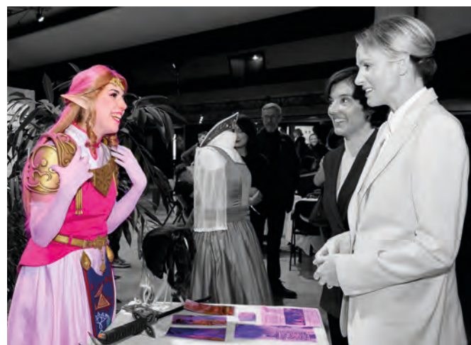
• S.A.S. la Princesse Charlène à l'atelier cosplay de la journée Powher