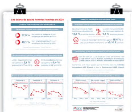
• Publication IMSEE sur les écarts de salaire