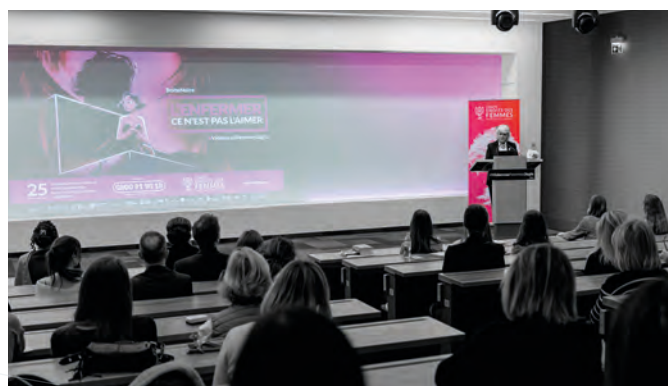
• Conférence sur la lutte contre les violences faites aux femmes