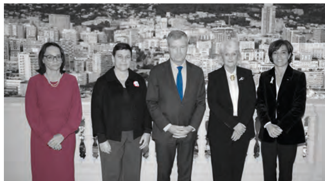
• Rencontre de Mme Isabelle Rome avec S.E. le Ministre d'Etat - © Direction de la communication