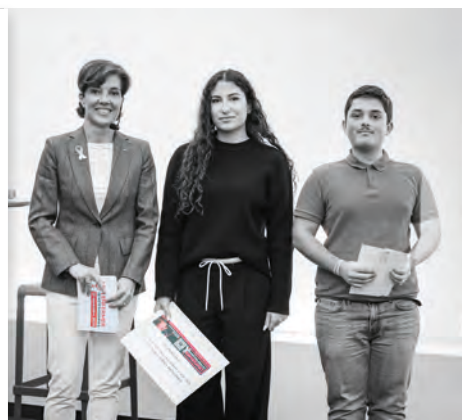
• Remise des prix du concours vidéo des lycéens / Lancement de la campagne du 25 novembre par S.E. le Ministre d'Etat