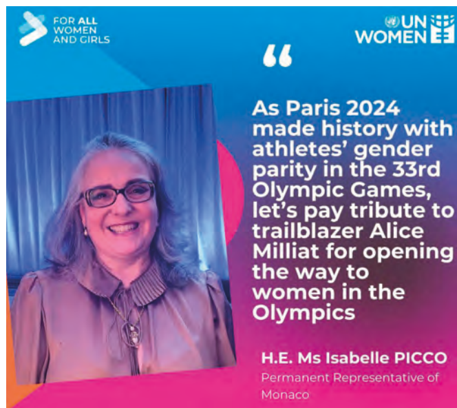
• S.E. Mme Isabelle Picco, Représentante permanente de Monaco auprès de l'ONU, s'est jointe à la campagne médiatique à l'occasion de la Commission sur la condition de la femme.