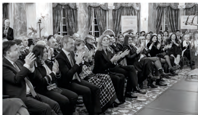
• ACDM : livres et remises des prix « Ma différence, ma force »

Les associations qui œuvrent en faveur des droits des femmes à Monaco bénéficient cette année encore d'une aide de la part du Gouvernement et du Comité pour les soutenir dans l'accomplissement de leurs actions. Sur la base d'un appel à projets, 17 projets présentés par le tissu associatif local ont obtenu une subvention en 2025.