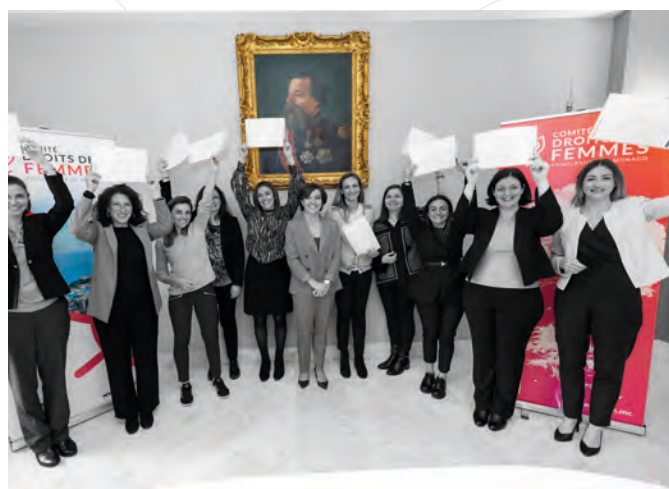
• Cohorte 2025 de l'Effet A