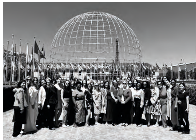
• Rassemblement informel des femmes diplomates, le 24 juin, en célébration de la journée internationale des femmes dans le multilatéralisme.

avec des victimes de violence, formations contre le sexisme dans l'Administration, campagnes de sensibilisation pour mobiliser la société dans son ensemble).