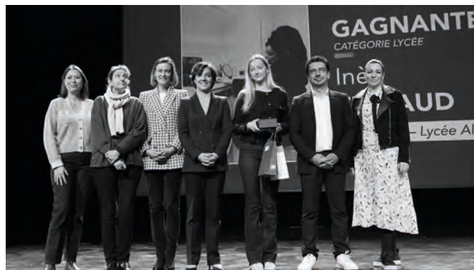
• Remise des prix du concours photo

Ce concours invitait à capturer ce que représentait la force féminine pour les collégiens et lycéens, qu'il s'agisse d'un portrait, d'un instant de vie ou d'un symbole fort. Les photos des participants étaient exposées à l'espace Léo Ferré pendant toute la journée puis récupérées par les élèves en souvenir de l'événement.