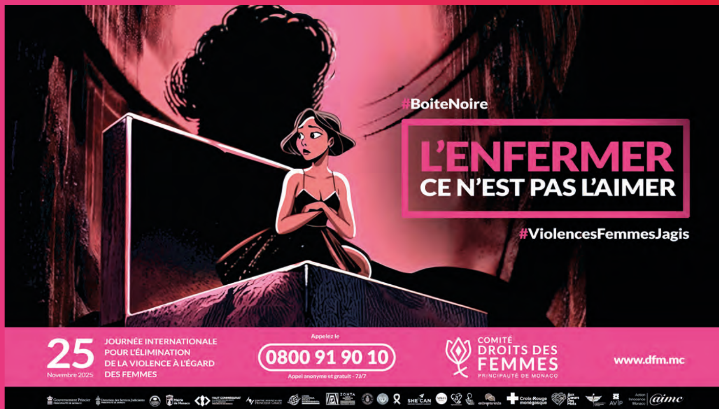
• Affiche de la Campagne

Ce film est disponible également en anglais avec la voix de Toby Wright, Ambassadeur des droits des femmes.