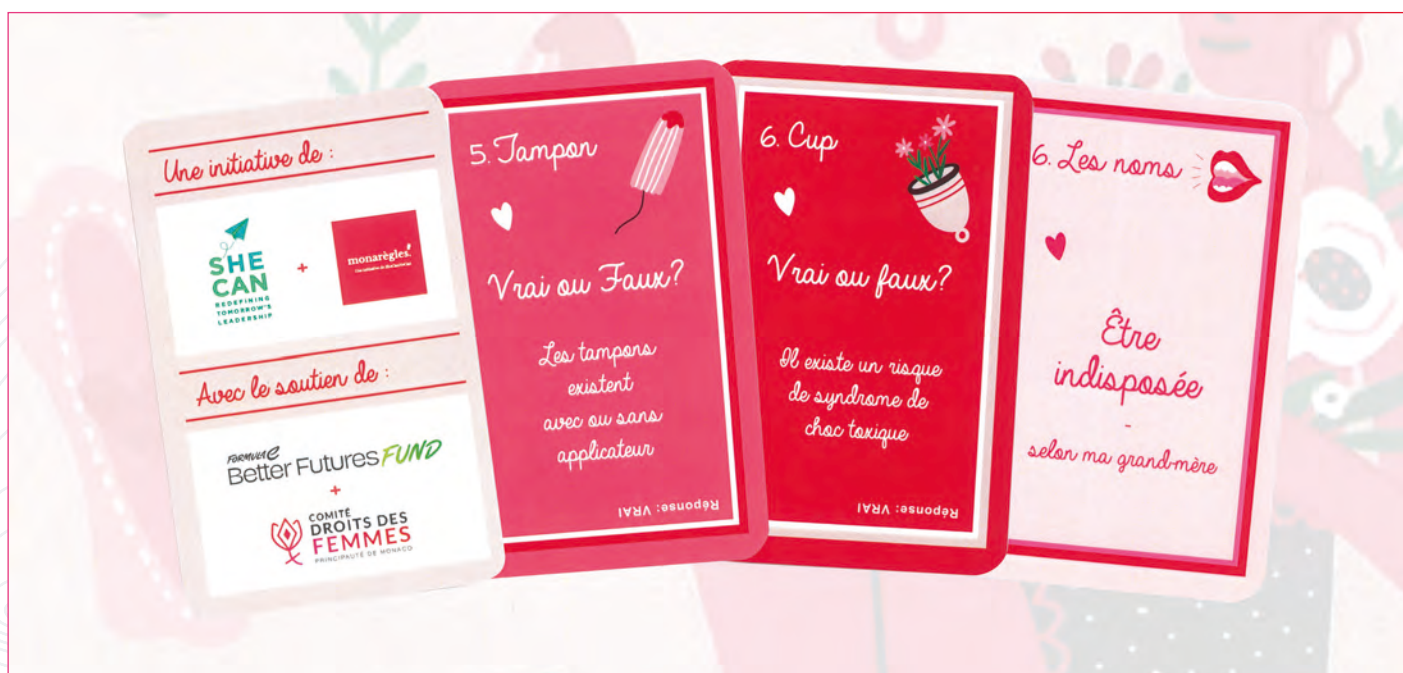
• SHECANHECAN - Jeu des 7 familles