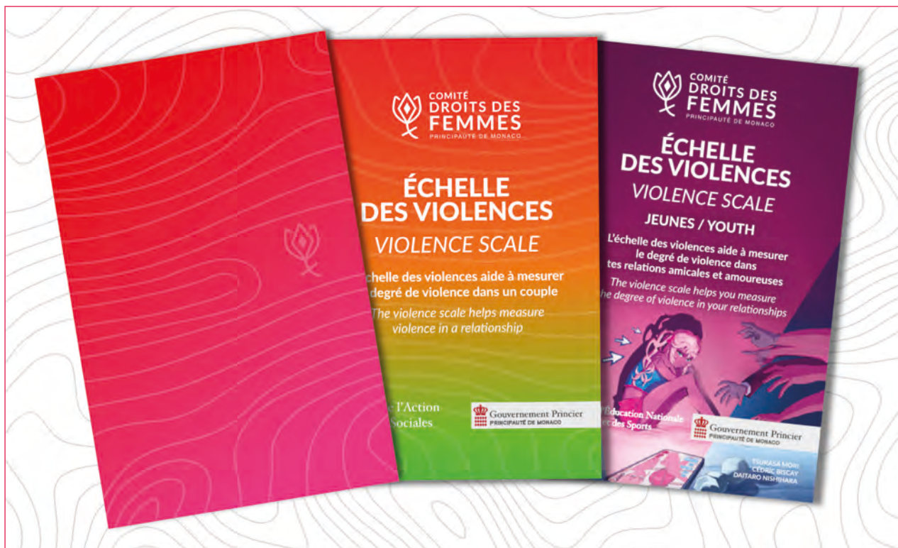
• Brochure banalisée et échelles des violences adulte et jeune

En 2025 les échelles des violences adultes et jeunes ont continué d'être distribuées aux différentes entités pouvant être amenées à recevoir des victimes de violences.