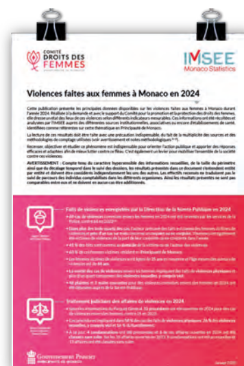
• Publication IMSEE sur les violences faites aux femmes en 2024 à Monaco

À l'occasion de la Journée internationale des droits des femmes, l'IMSEE a publié une infographie sur la représentation des femmes dans la gouvernance d'entreprises en 2024. Il en ressort que les femmes constituent 28,6 % des dirigeants d'entreprise. Si leur présence progresse au fil des années, elles restent toutefois minoritaires dans l'ensemble des secteurs d'activité.