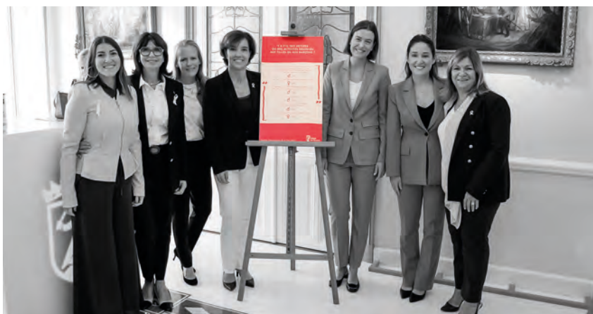
• Journée de la fille à la mairie

Le Maire invitait des personnalités engagées pour les droits des femmes à venir découvrir l'exposition éphémère de cinq tableaux présentés dans le Hall de la Mairie, reprenant les réponses des enfants du Mini-Club questionnés sur des sujets en lien avec l'égalité femmes-hommes dans le cadre d'un atelier dédié.