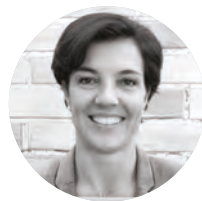
Céline Cottalorda Délégue Interministérielle pour la promotion et la protection des droits des femmes