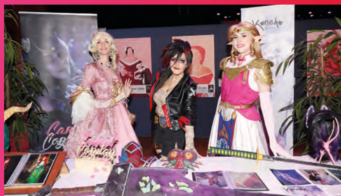
• Atelier cosplay