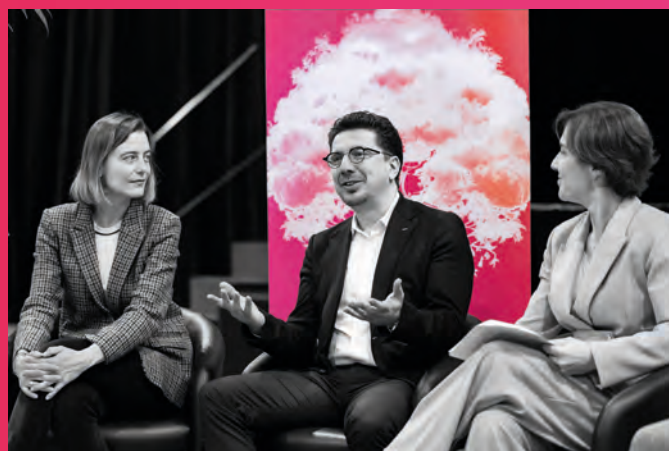
• Conférence de presse pour le 8 mars 2025