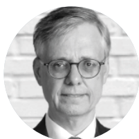
Lionel Beffre Conseiller de Gouvernement- Ministre de l'Intérieur