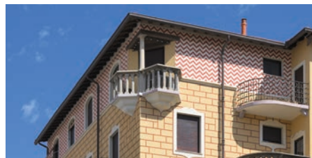
Juan-les-Pins

Tarif réduit : 4,50€/personne (Enfant entre 8 et 16 ans, étudiants, personnes en situation de handicap, demandeurs d'emploi, guides-conférenciers). Gratuit pour les moins de 8 ans. Durée 1h30/2h.