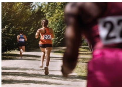
Triathlon