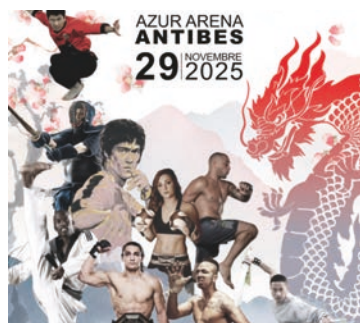
Grande nuit des arts martiaux