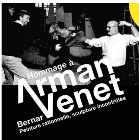
©Hommage à Arman - Exposition de Venet