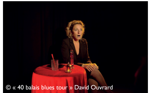
© « 40 balais blues tour » David Ouvrard