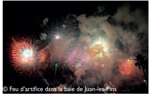
© Feu d'artifice dans la baie de Juan-les-Pins

Infos et réservation: www.anthea-antibes.fr - 04 83 76 13 00