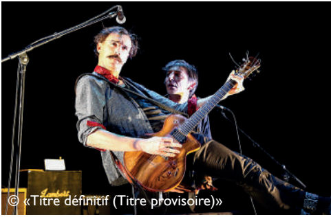
© « Titre définitif (Titre provisoire) »

Mercredi 14 et 16 décembre à 21h, jeudi 15 à 20h30