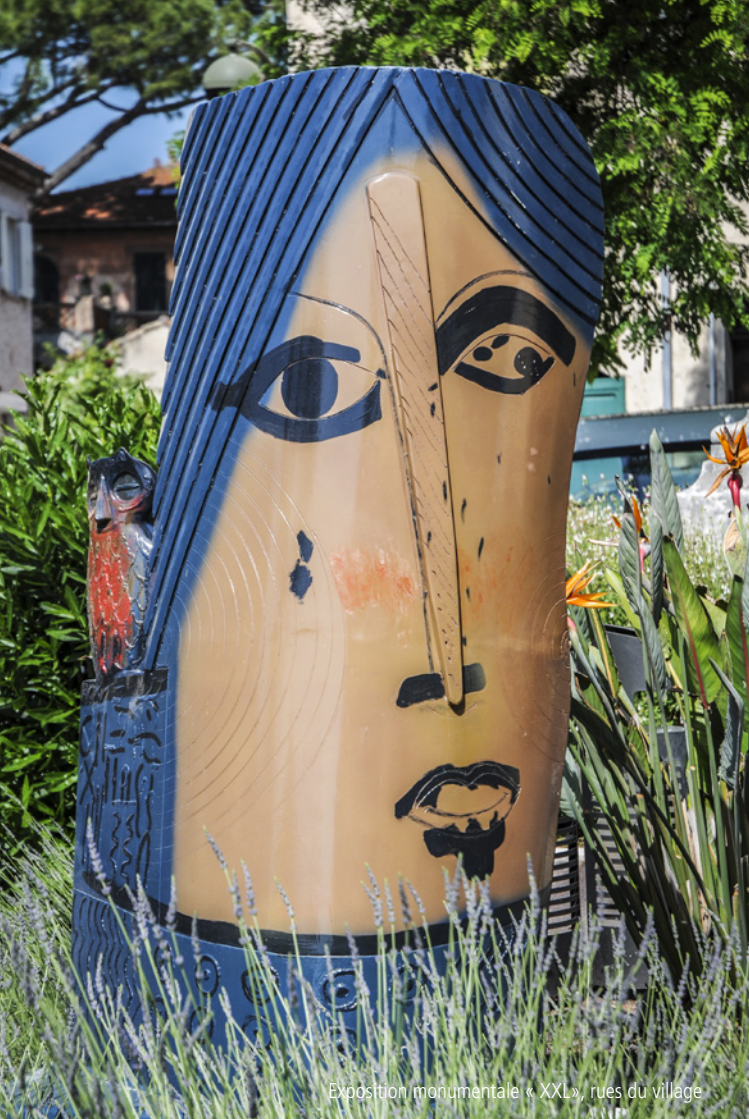
Exposition monumentale « XXL », rues du village