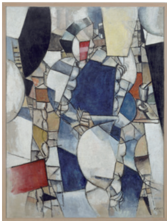
Fernand Léger, Esquisse pour la femme en bleu, 1912, Huile sur toile. Donation de Nadia Léger et Georges Bauquier, 1969. Musée national Fernand Léger, Biot

L'exposition Vis-à-vis. Fernand Léger et ses amis : Alexandre Archipenko, Jean Arp, Alexander Calder, Joseph Czaky, Robert Delaunay, Juan Gris, Henri Laurens, Le Corbusier, Jacques Lipchitz, Amédée Ozenfant inaugure le premier volet d'une programmation artistique et culturelle consacrée aux échanges, amicaux et artistiques, que le peintre Fernand Léger a entretenus avec les artistes de son temps. Cette exposition s'inscrit dans le contexte d'une année 2017 dédiée à la célébration de l'œuvre de Fernand Léger.