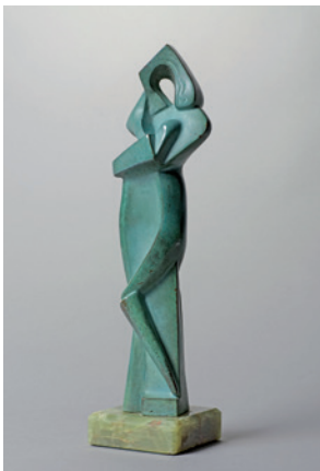
Alexander Archipenko, Figure debout , 1917. Bronze. Patine verte. Achat à la galerie Wilhelm Grosshennig en 1964 Musée national d'Art Moderne / Centre de création industrielle, Paris. © Estate of Alexander Archipenko / Adagp, Paris, 2017.