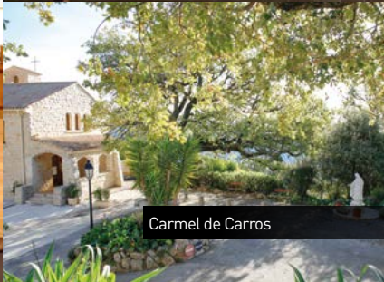
Carmel de Carros