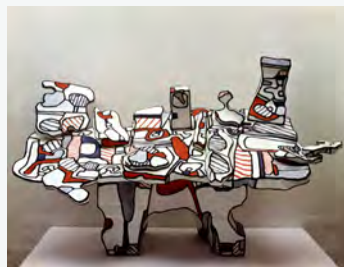
Jean Dubuffet, Table porteuse d'instances, d'objets et de projets (de face), 1968, Collection Jean Dubuffet, Paris, ©ADAGP 2022

Retrouvez aussi la collection permanente de Matisse.