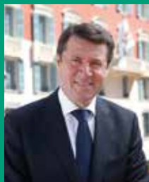
Christian Estrosi Maire de Nice Président de la Métropole Président délégué de la Région Sud Provence-Alpes-Côte d'Azur

« Patrimoine pour tous, ensemble, faisons vivre le patrimoine ». Quel merveilleux thème retenu pour ces 38 èmes Journées européennes du patrimoine !