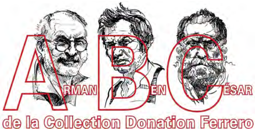
Arman, Ben, César, l'ABC de la Collection Donation Ferrero