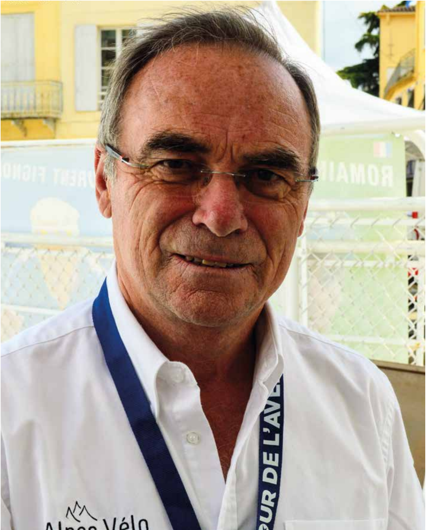
Bernard Hinault en août 2019