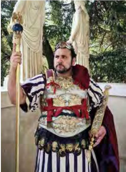
Valério Bello crédit Augustus Caesar Praetoria

POUR SON EXPOSITION DU MOMENT, LE MUSÉE D'ARCHÉOLOGIE DE NICE-CIMIEZ REVÊT UNE PANOPLIE EN TOTAL LOOK INSPIRÉE PAR LES COQUETTERIES DES EMPEREURS ROMAINS.